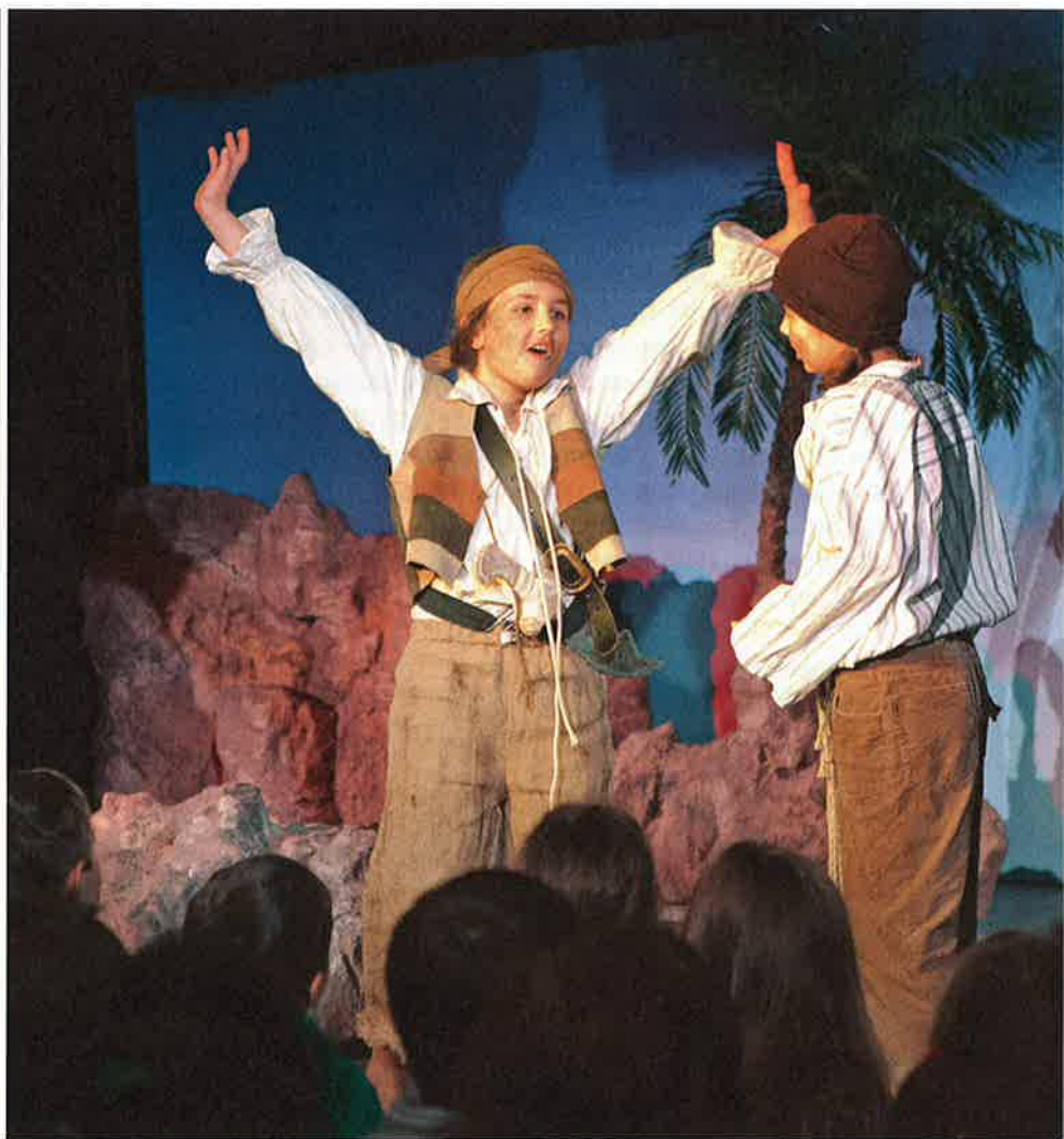
Kein Wunder: Hier gilt es, Abenteuer auf der Schatzinsel zu bestehen.